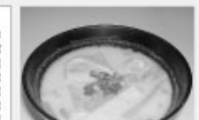
ご注意:酒粕をつぶすとき、ミキサーを使用すると簡単ですよ！